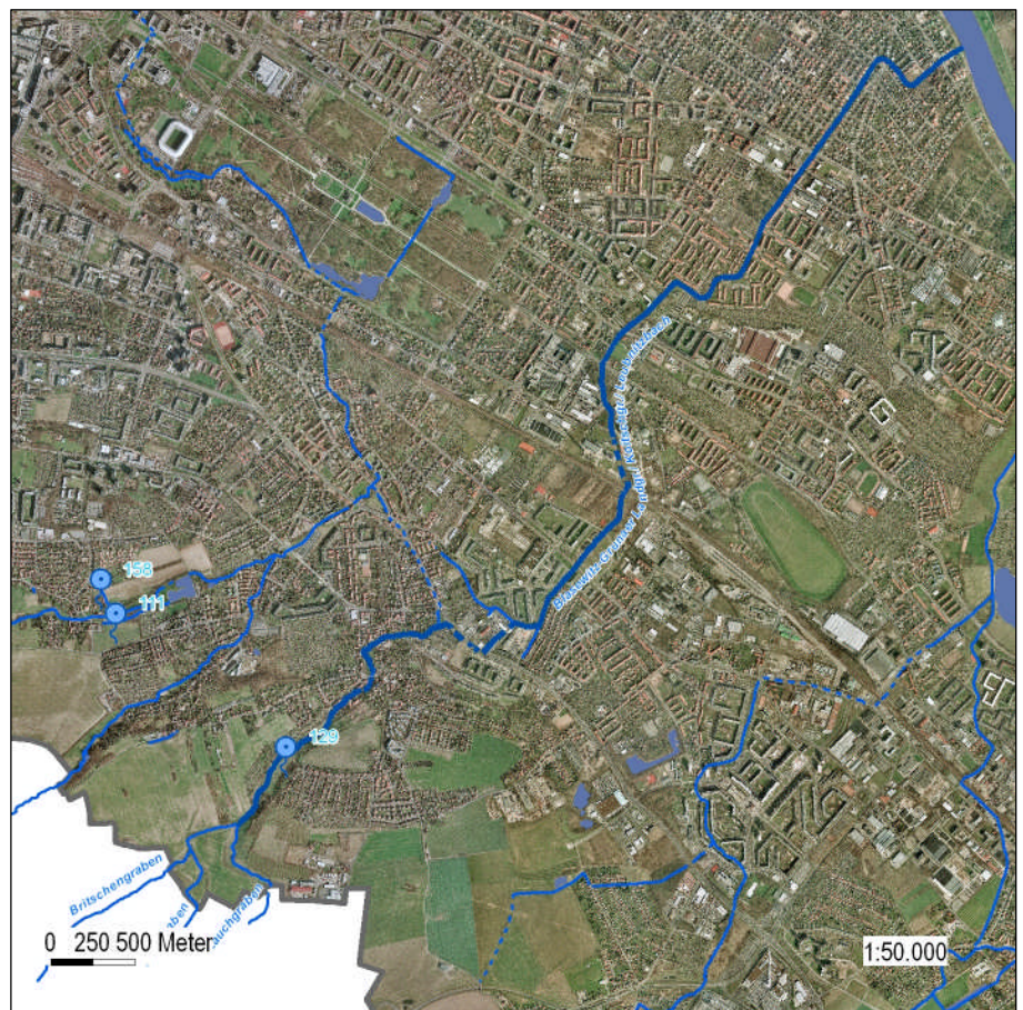
Abb. 1: Blasewitz-Grunaer Landgraben/ Koitschgraben/Leubnitzbach