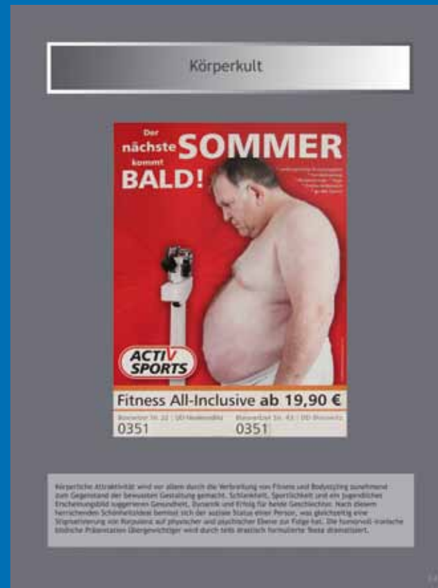
■ Tafel 2.4