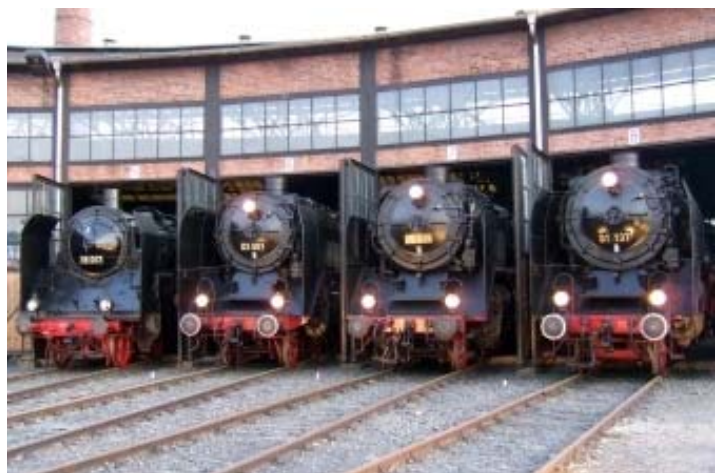
Beim Dresdner Dampfloktreffen stellen sich die historischen Lokomotiven zum Fototermin an Deutschlands größter Drehbühne.