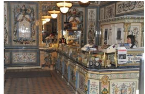
Blick in den „Schönsten Milchladen der Welt“.