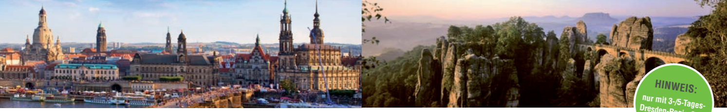
1 Blick auf die Altstadt Dresdens 1 Basteifeisen, beliebtes Ausflugsziel in der Sächsischen Schweiz

HINWEIS: nur mit 3-/5-Tages-Dresden-Regio-Card möglich