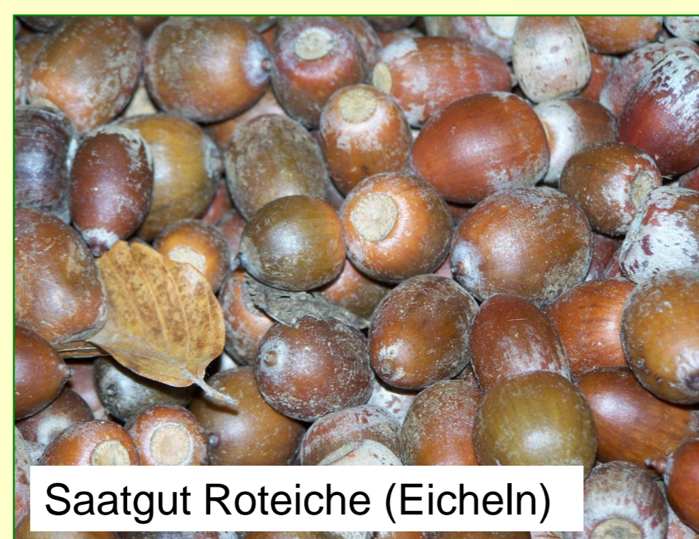
Saatgut Roteiche (Eicheln)