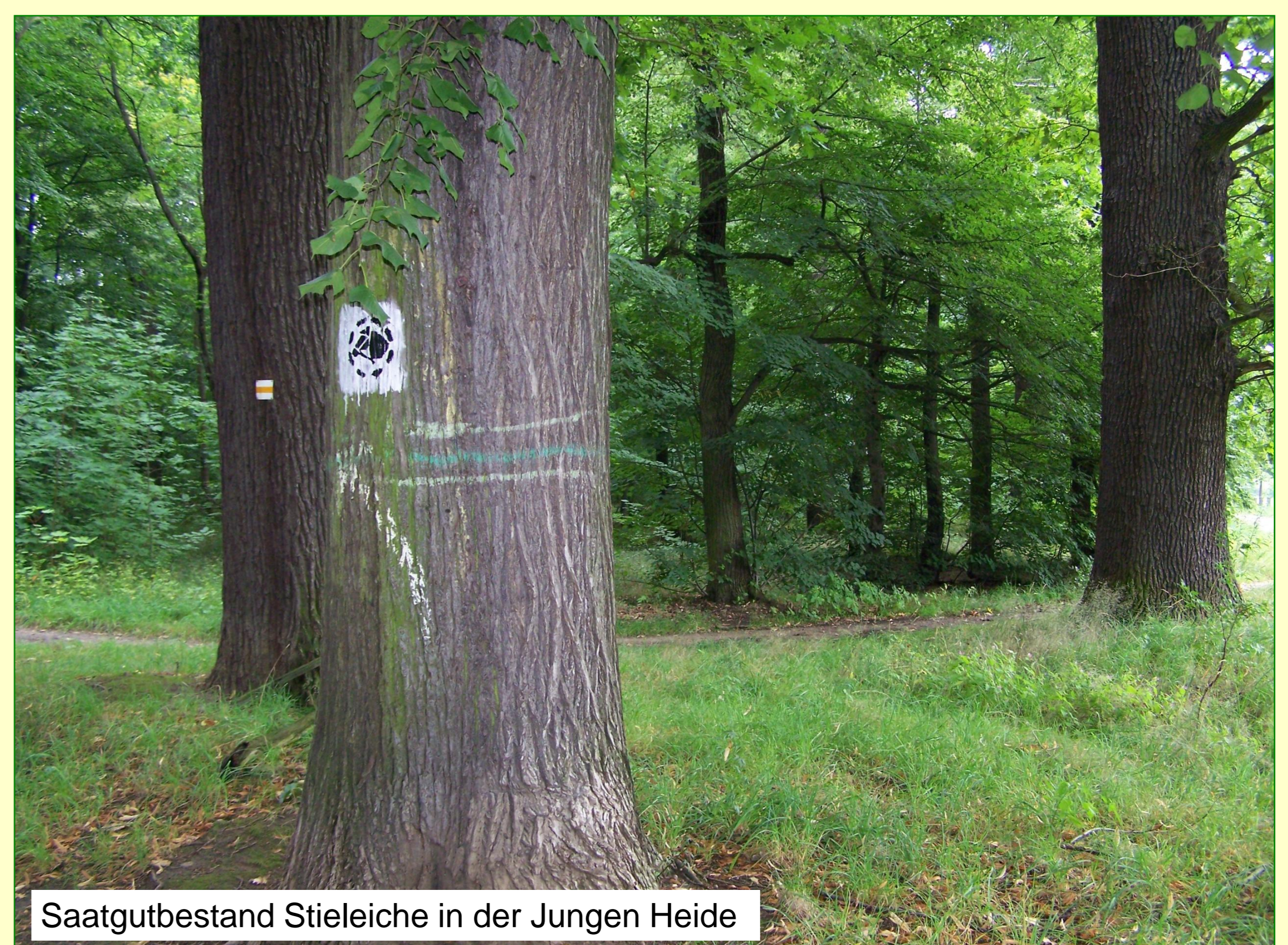
Saatgutbestand Stieleiche in der Jungen Heide

Kontakt: Grunaer Straße 2, 01069 Dresden • Postfach 120020, 01001 Dresden Telefon (03 51) 488 71 01 • Telefax (03 51) 488 71 03 Email stadtgruen-und-abfallwirtschaft@dresden.de • www.dresden.de