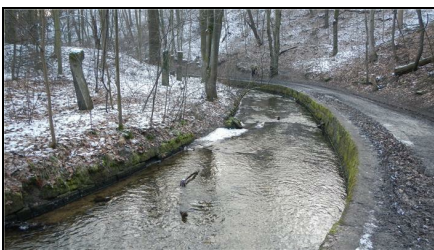
Abb. 1: Ufer rechtsseitig mit Ufermauer und "Prießnitzgrundweg", 06.02.2018