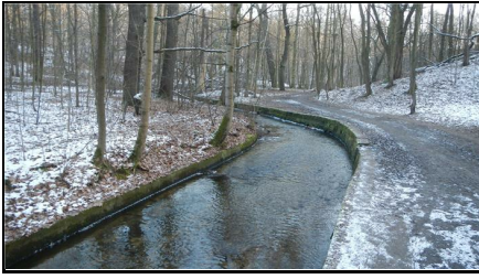
Abb. 2: Vor der Maßnahme: Uferverbau linksseitig mit Sandsteinquadern, 06.02.2018