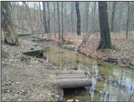
Abb. 4: Nach der Maßnahme: Fischunterstand, 09.12.2020