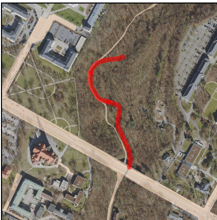
Lageplan Maßnahme, Maßstab 1:10.000