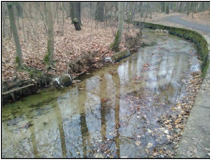
Abb. 3: Nach der Maßnahme: partiell rückgebaute Ufermauern, Bühnen zur Strömunglenkung und Initiierung von Sohlstrukturen, 09.12.2020