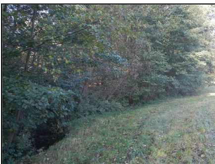
Abb. 1: vor der Maßnahme: rechtsseitig fehlender Gewässerrandstreifen bei Grünlandnutzung, keine Gehölze, 17.10.2017