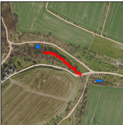
Lageplan Maßnahme, Maßstab 1:10.000