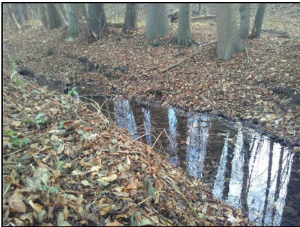
Abb. 4: Nach der Maßnahme: Erlen-Jungpflanzen im unteren Böschungsbereich, 11.12.2020