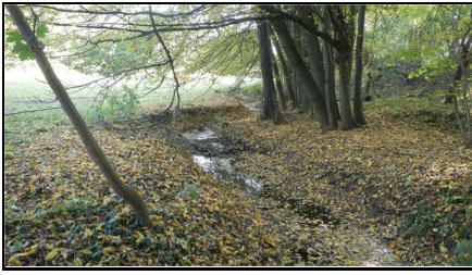
Abb. 2: Vor der Maßnahme: lückenhafter Gehölzgürtel, 17.10.2017