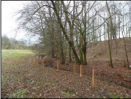
Abb. 3: Nach der Maßnahme: Mit Pfählen markierte Gehölzjungpflanzen (Erle, Esche, Traubenkirsche, Eiche) an der Böschungsoberkante, 13.01.2021