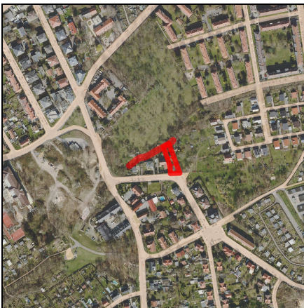
Lageplan Maßnahme, Maßstab 1:10.000