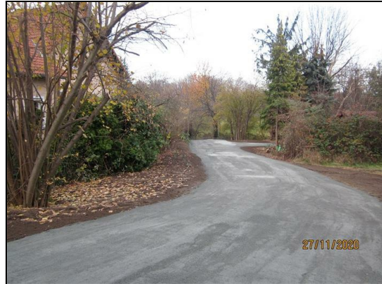
Abb. 3: Neu errichteter Zufahrtweg zum Roßthaler Bach für die Gewässerunterhaltung für die g. 27.11.2020