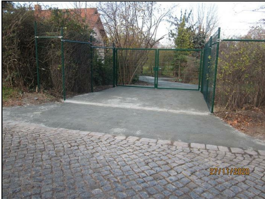
Abb. 2: Zugang von der Kölner Str. zu Flst. 4d mit neu errichtetem Tor, 27.11.2020