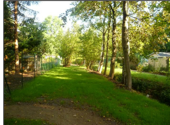
Abb. 5: Leubnitzer Mittelgraben, 21.08.2019

Gewässerrandstreifen (Wegbefestigung etc.) - neuen Zaun an Gewässerrandstreifen zu Gärten - bachbegleitender Weg - Bepflanzung Gewässerrandstreifen - Ausführungszeitraum April 2019