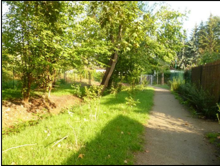
Abb. 3: Leubnitzer Mittelgraben, 21.08.2019