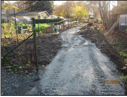
Abb. 2: Leubnitzer Mittelgraben, 14.11.2018