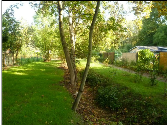
Abb. 4: Leubnitzer Mittelgraben, 21.08.2019