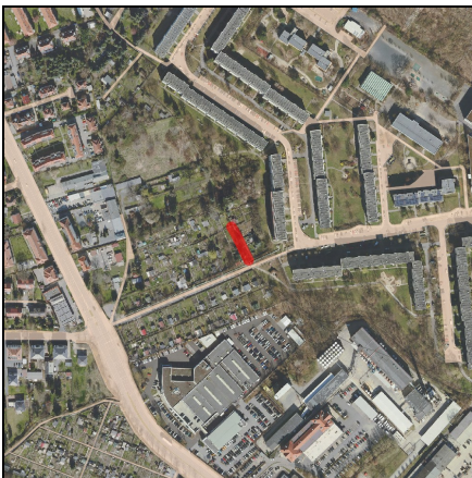
Lageplan Maßnahme, Maßstab 1:10.000