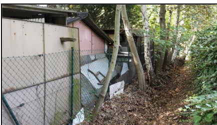
Abb. 1: Leubnitzer Mittelgraben im Bereich der Kleingartenanlage vor der Maßnahme, 31.08.2018